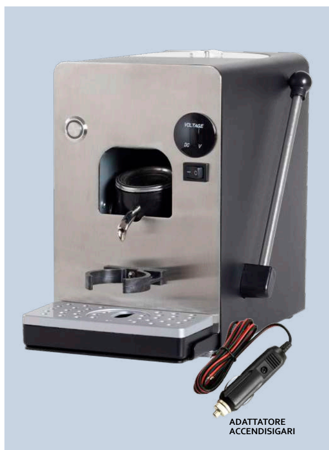
MACCHINA DA CAFFE' 12V o 24V